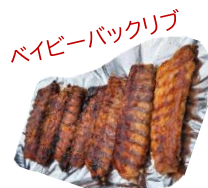
パイビーバックリブ