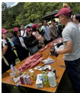
社長と新入社員が作る パイビーバックBBQ!!

新入社員と交流を深めるための全社BBQです。 「社長賞の表彰」や「新入社員+入社1年未満社員の紹介」「食育体験コンテンツ」「懇親企画」など、 役職や部署の垣根を超え絆を深めたり、社員の家族同士の交流の場にもなっています。