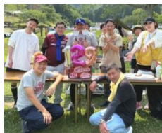
新入社員 NEWAGE社員の紹介