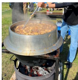
野菜のお出汁とお肉の 旨味で最高！

社員家族はもちろん、お世話になっているメーカー様との交流を深めるための芋煮会です。 芋煮は山形の郷土料理なので、本場山形県産の材料を中心に芋煮を作っています。 自然豊かな場所で大きな鍋を囲み、仲間と食べる食事は格別です！