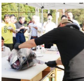
本マグロの解体ショー