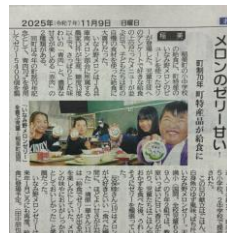
神戸新聞にも掲載いただきました。

地域生産者と学校給食、製造メーカーをつなげることで、地産商品を開発し、地産地消の推進と、地場産物の魅力を伝えています。2025年度は10品の開発をおこないました。